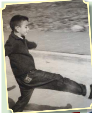
ברוידא. בעיקר סקרן